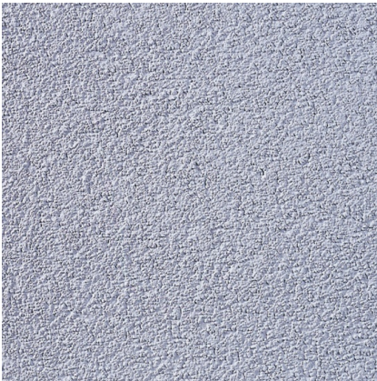
Kornstruktur (K) - 1,5mm - mit Kunststoff-Reibebrett strukturiert